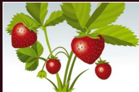
Mejor calidad de fruto y más ventajas comerciales.