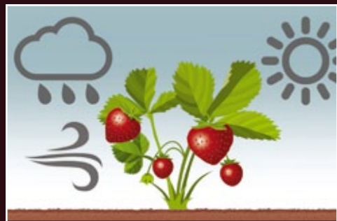
Planta más fuerte y resistente a cualquier situación de estrés.

Con MicroSoil se mejora la estructura del suelo contribuyendo a un mayor desarrollo radicular en la rizosfera, especialmente de los pelos absorbentes, permitiendo a la planta una mayor absorción de nutrientes y con ello obtener importantes beneficios para el cultivo, que se traducen en una mayor rentabilidad.