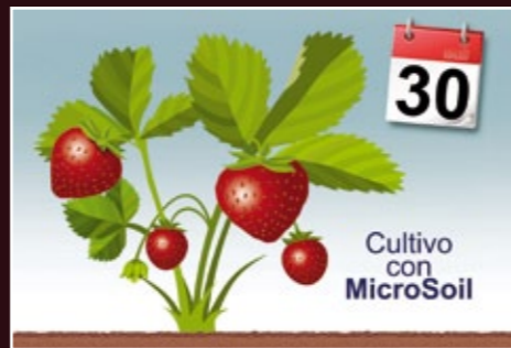
Mayor longevidad del cultivo y por lo tanto ciclo productivo más largo.