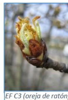
EF C3 (oreja de ratón)

A partir del estado fenológico C3 (Oreja de ratón – BBCH 10) el cultivo es sensible a moteado.